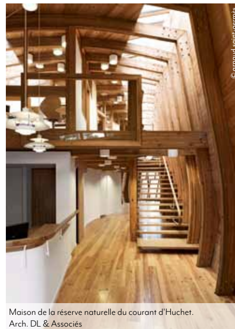
Maison de la réserve naturelle du courant d'Huchet. Arch. DL & Associés

Atlanbois, association interprofessionnelle de la filière bois des Pays-de-la-Loire, poursuit son action de promotion en mettant à la disposition de chacun une médiathèque consultable en ligne recensant des milliers de documents et visuels. En seulement quelques clics, les internautes ont accès à un riche catalogue recensant de nombreuses thématiques : métiers et formations, forêts, essences, construction, énergie, photothèque... Bientôt, le bois n'aura plus de secrets pour vous !